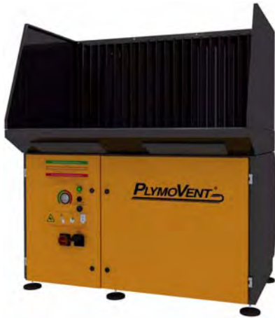
Afbeelding: afzuigtafel met kit voor achterafzuiging en zijpanelen